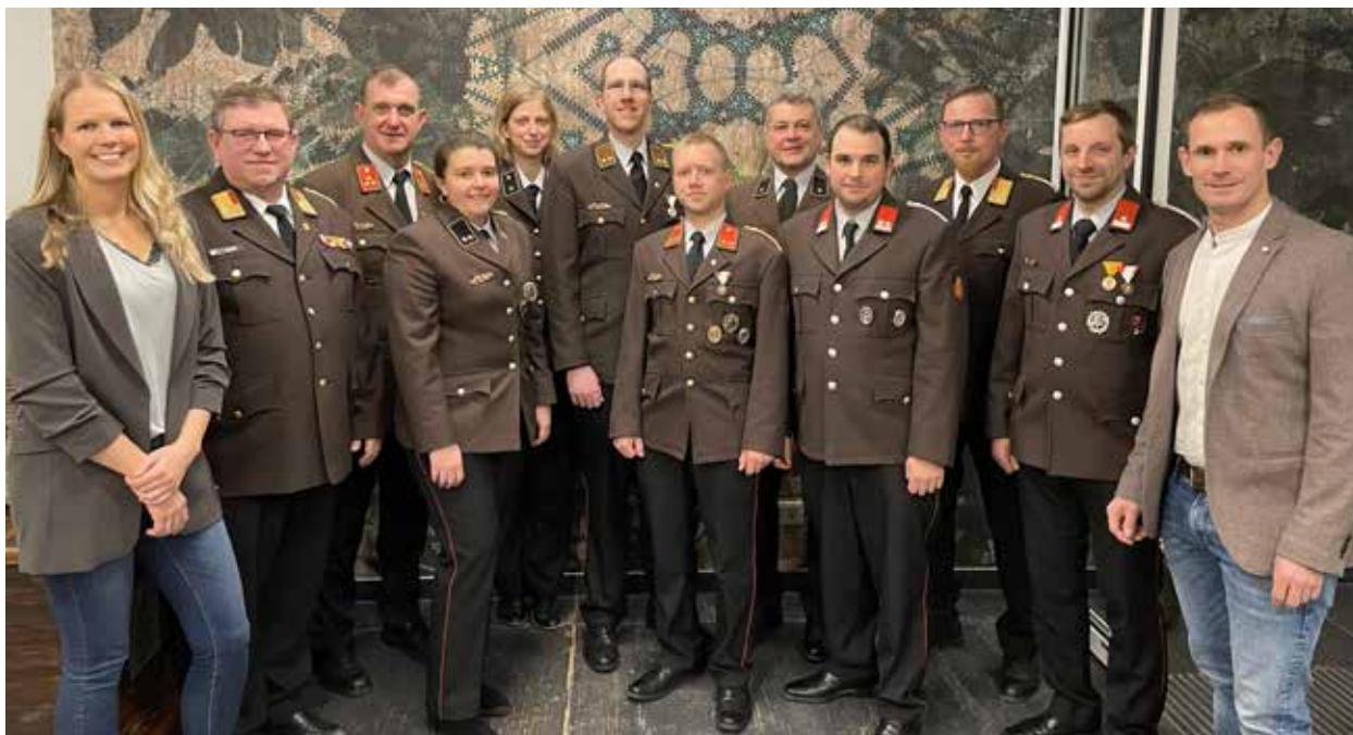
Neuwahl des Kommandos anlässlich der 126. Vollversammlung