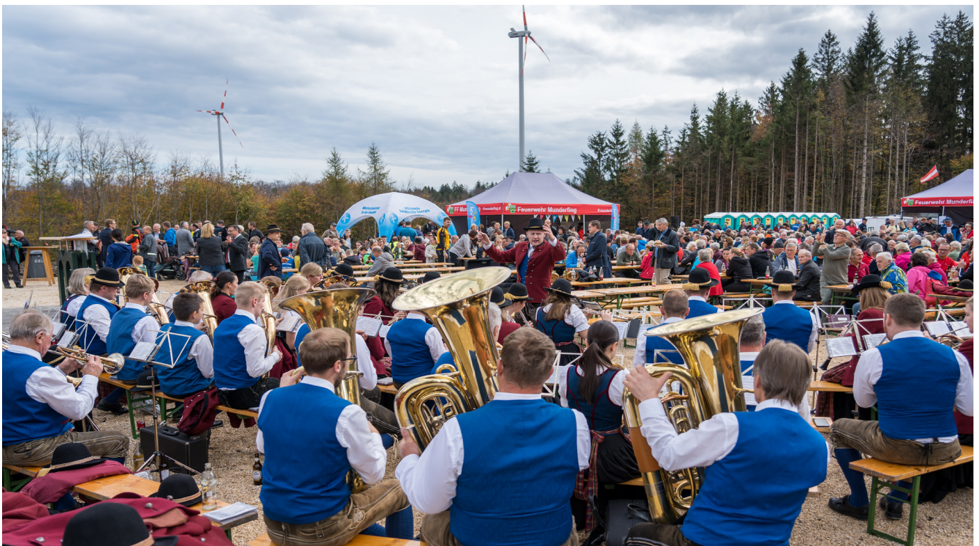
Eröffnung 6. Windkraftanlage am 26.10.2022

Hand besprechen zu können. Die Termine dazu und die Anmeldemöglichkeit entnehmen Sie bitte der Gemeinde-website.