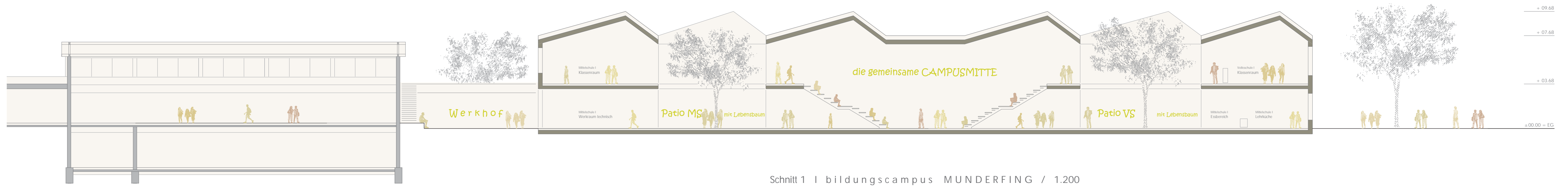
Schnitt 1 | bildungscampus MUNDERFING / 1:200