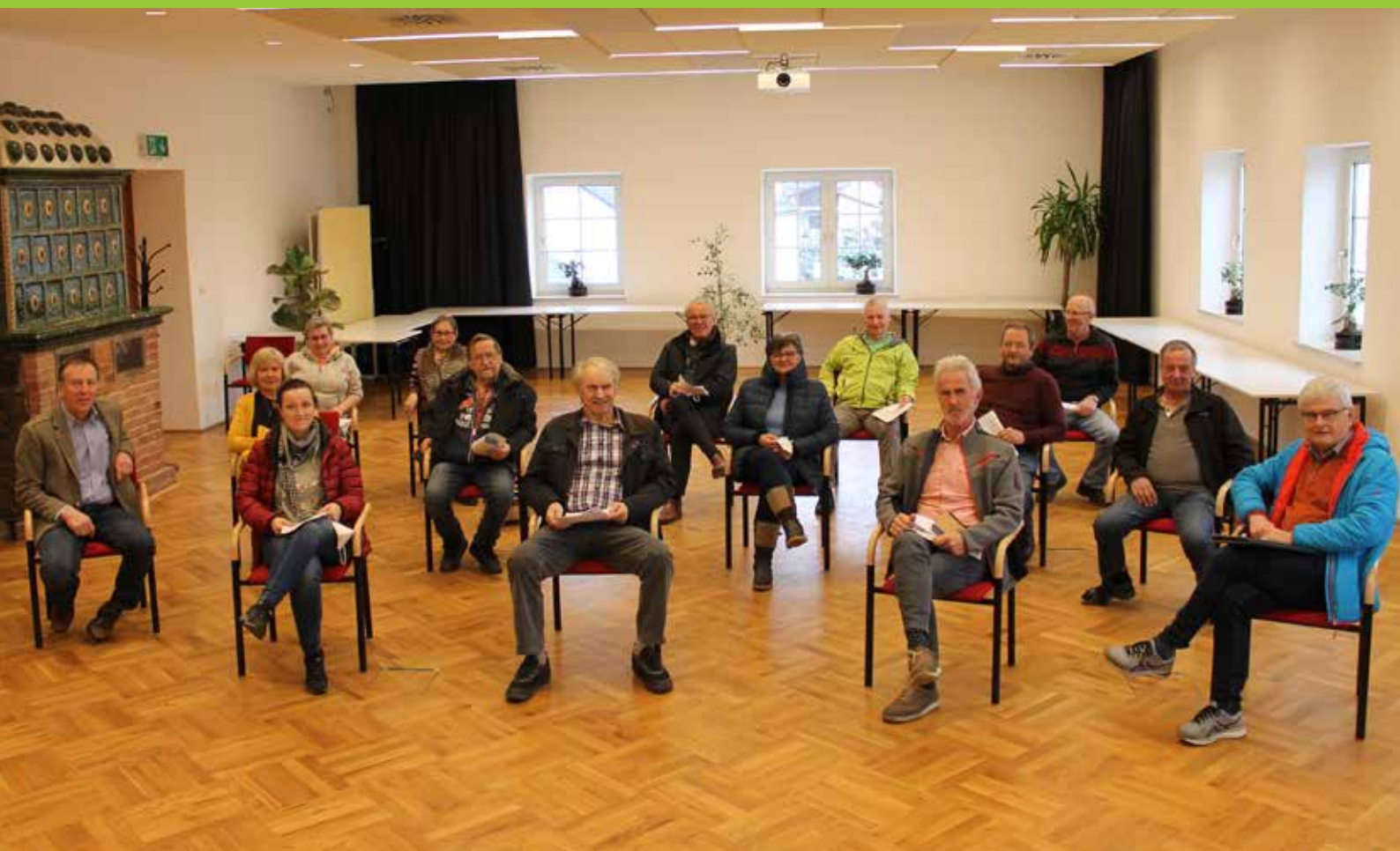
Foto: Ehrenamtliche Helfer/innen beim Auftaktgespräch