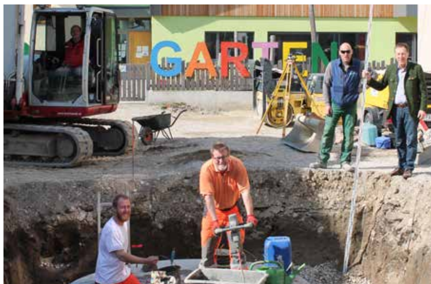
Die Bauarbeiten im Bereich des Kindergartenvorplatzes schreiten voran.