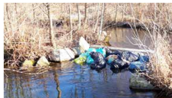
Illegale Müllablagerung in Pfaffing

in der Umwelt genützt haben! Man möchte sich gar nicht vorstellen, wie es neben den Straßen aussehen würde, wenn diese fleißigen Helfer/innen nicht immer wieder aufs neue den Müll einsammeln - DANKE!