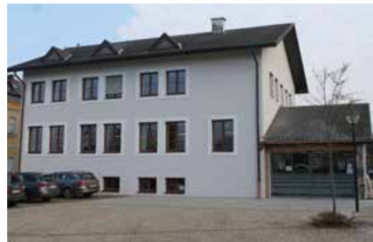
Sanierte Fassade und Eingangsbereich des Gemeindeamtes

Hier angeführt sind nur einige der im Jahr 2019 umgesetzten bzw. gestarteten Projekte: