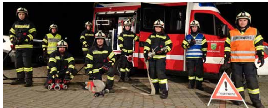
Grundlehrgangsteilnehmer der FF Achenlohe