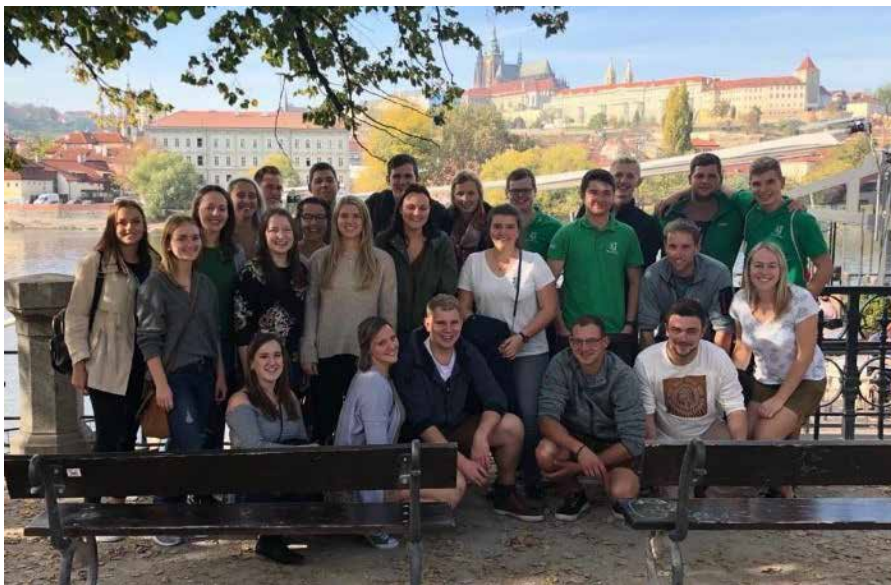
Landjugend Ausflug nach Prag

Zahlreiche Mitfeiernde kamen in ihren Siebenbürger und Banater Trachten.