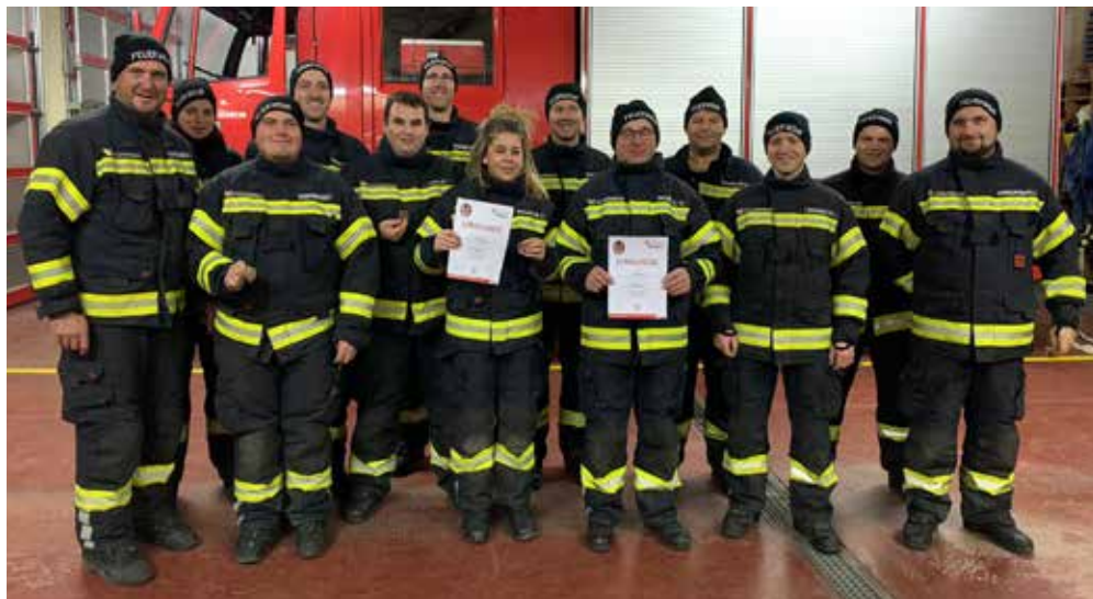
Absolventen des Branddienstleistungsabzeichens

Übungsannahme war ein Brand in der Maschinenhalle beim „Hausl“ in Ach. Nach erster Erkundung des