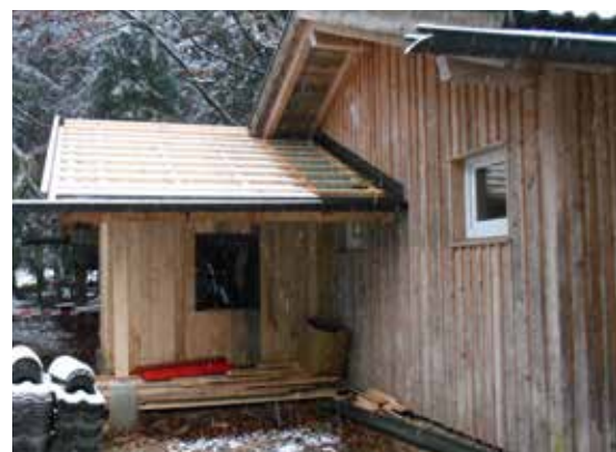
Neues WC für die Waldkindergruppe

malere, ihnen angenehmere Rahmenbedingungen für ihre körperlichen Bedürfnisse vor.