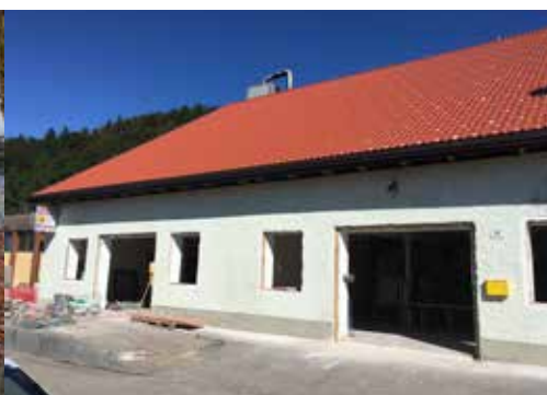
Sanierung der ehemaligen Tischlerei Maiburger