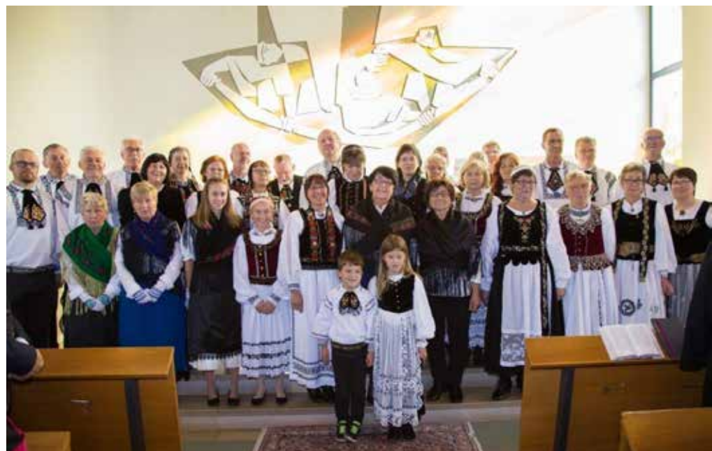
Gedenkgottesdienst in der evangelische Kirche in Mattighofen