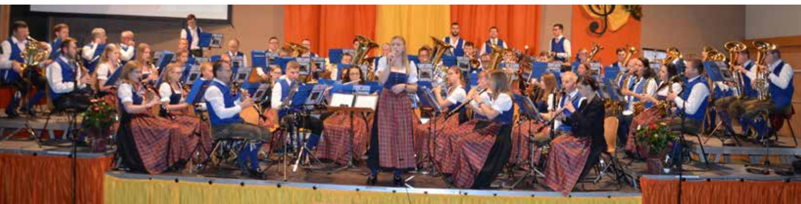
Herbstkonzert der Ortsmusik Munderfing