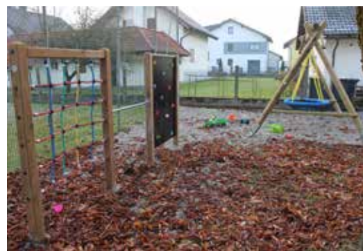
Ankauf von Spielgeräten für den Spielplatz Höllersberg