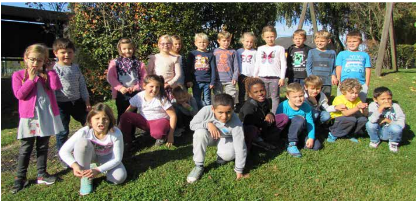
1 Klasse am Spielplatz

Die Schulleitung und das Lehrer/innenteam der VS Munderfing bedanken sich bei der Gemeinde Munderfing für die Bereitstellung der Schulhefte und die neue Blumentrog/Bankgruppe vor dem Schulhaus und wünscht allen ein erfolgreiches Schuljahr.