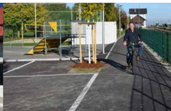
Geh- und Radweg zum Bahnhof