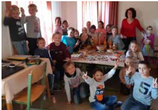
Gesunde Jause von den Bäuerinnen